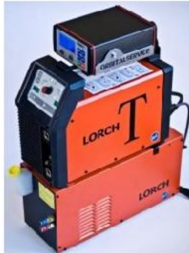
T-220 mit Steuerung OWC plus und WUK 6