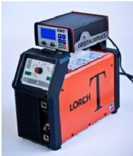
T-220 mit Steuerung OWC plus

Manueel worden diameter,lassnelheid en stroomsterkte ingesteld waarna het systeem automatisch bepaald wat de beste rotatie snelheid is en een perfecte las garandeert.